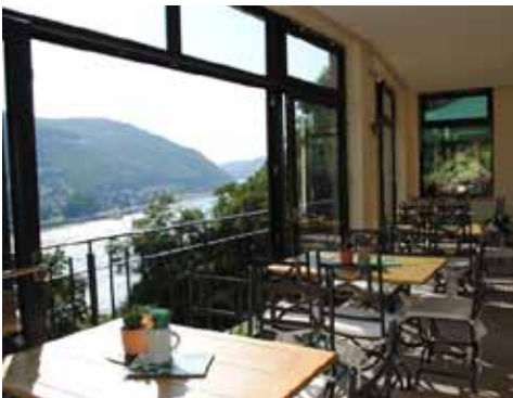
Das Ambiente ist puristisch und ohne Brimborium – gemäß authentischer ‚Tafernwirtschaft‘.